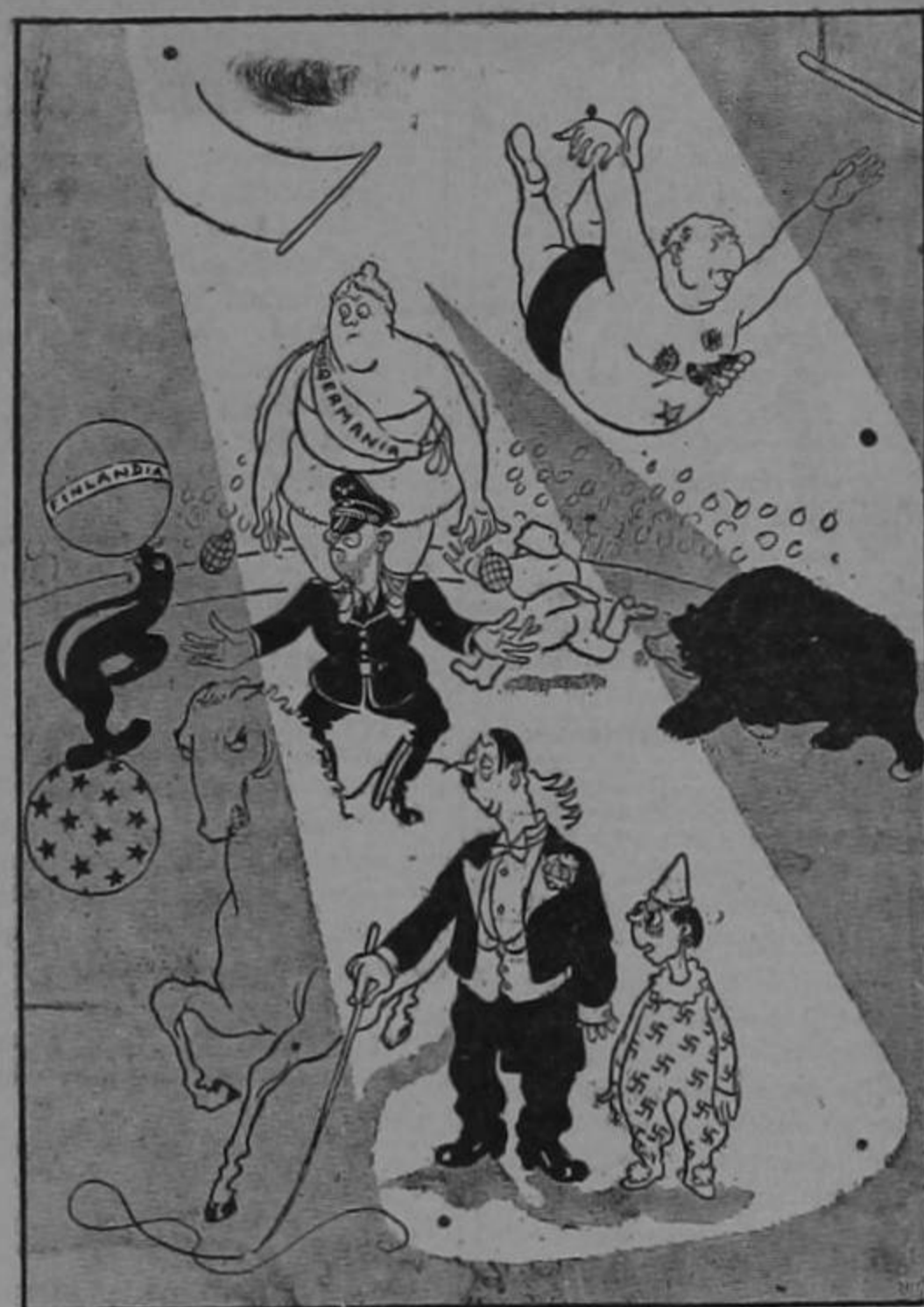
“Fué una idea magnífica la de poner todos estos actos al mismo tiempo”.