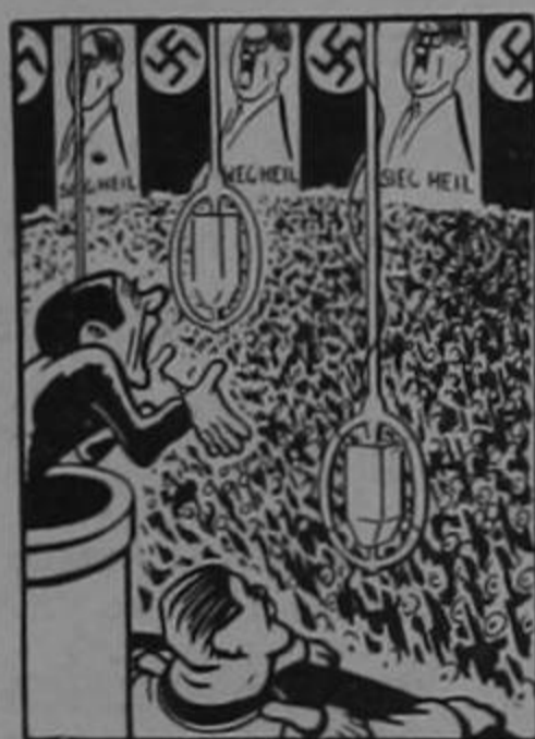
Dr. Goebbels: (Sportpalast Berlín 1943): “Yo os pregunto: deseáis la guerra total y absoluta?” “JA!!!!..”