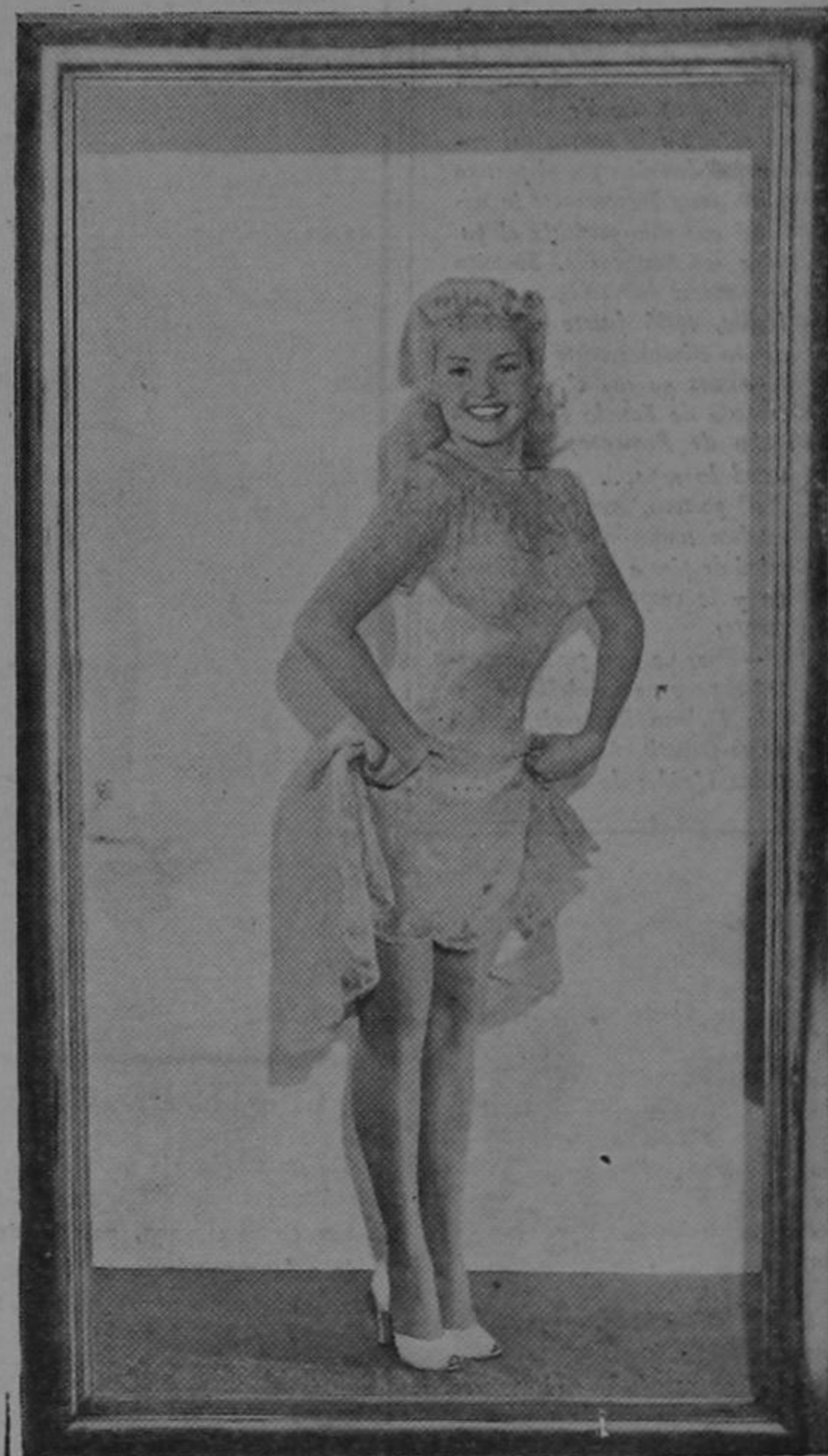
Vitamina para los casados

Pero bien, si es que en materia de investigación de un delito que está en secreto se impone la publicidad, apaga y vámonos!